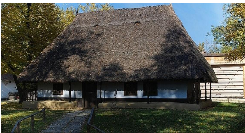
Casă din Dumbrăveni expusă la Muzeul Național al Satului „Dimitrie Gusti” din București