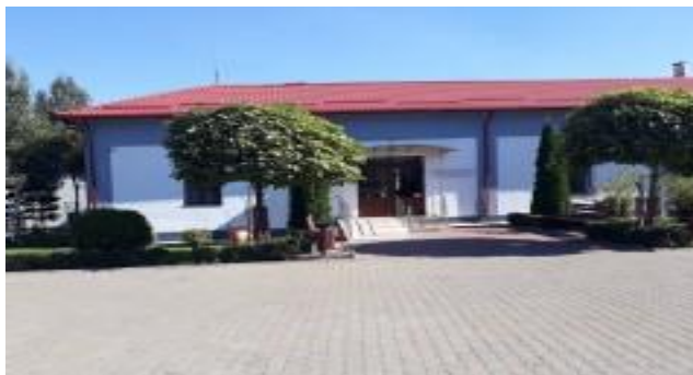
Unitatea de Asistență Medico-Socială Dumbrăveni

În comuna Dumbrăveni funcționează în acest moment: 1 Unitate de Asistență Medico-Socială, 6 cabinete medicină de familie, 3 farmacii și 4 cabinete stomatologice.